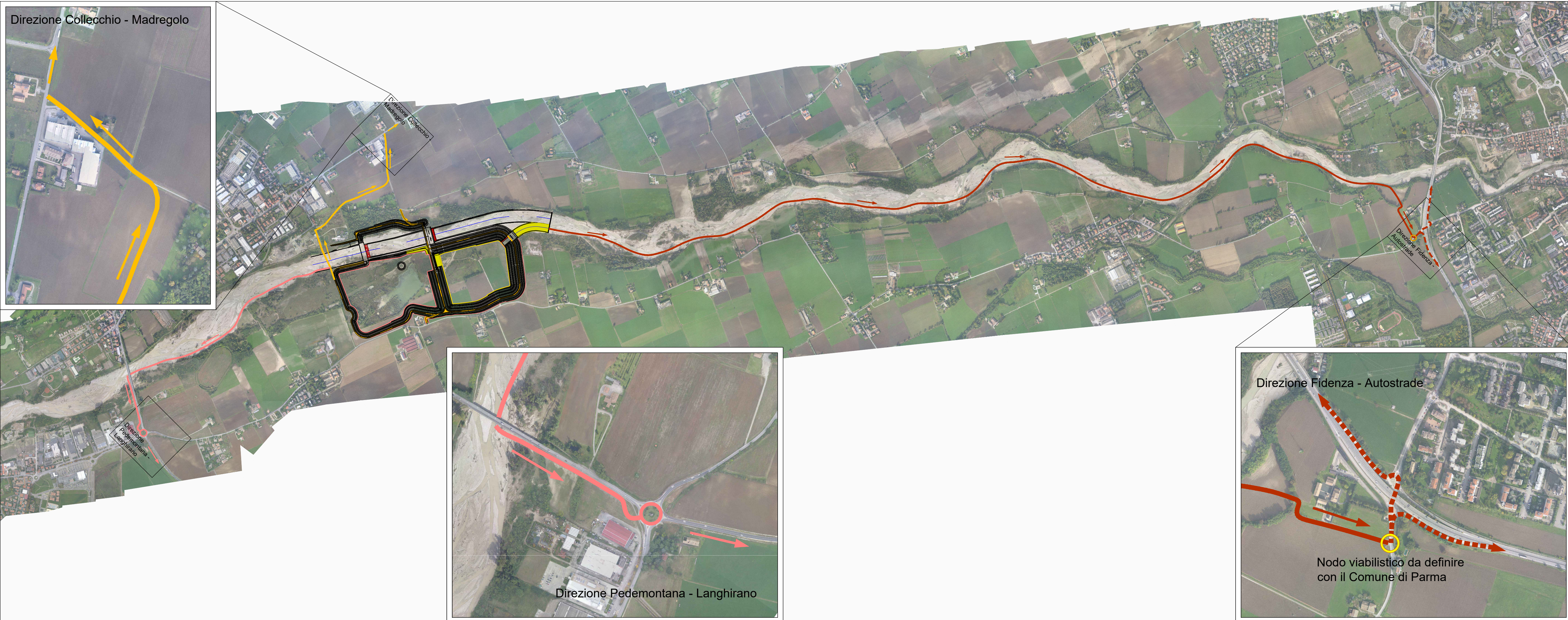
TAVOLA: 1- Viabilità di servizio per il trasporto in fase di cantierizzazione dell'opera SCALA: 1:15.000

AMBITER S.r.l. via Nicodoli, 5/A 43126 Parma tel. 0521-942630 fax 0521-942436 www.ambiter.it info@ambiter.it